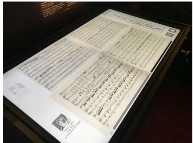
Figura 2. Dimostrativo installato presso il Museo teatrale alla Scala basato sul formato IEEE 1599.

Ad esempio, lo standard viene regolarmente utilizzato per la realizzazione di dimostrativi all’interno di mostre ed eventi pubblici. Da questo punto di vista, vale la pena citare la collaborazione di lungo termine con istituzioni quali il Ministero per i Beni e le Attività Culturali, l’Archivio Storico Ricordi, il Teatro alla Scala di Milano, e – in tempi più recenti – Palazzo Reale di Milano e Paul Sacher Stiftung. 2 In Figura 2 viene mostrato l’applicativo attualmente installato presso il Teatro alla Scala di Milano nell’ambito della mostra “Gioachino Rossini al Teatro alla Scala”.